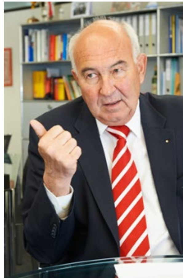
«La collaboration avec les cantons a parfois ressemblé à un exercice d'équilibre.»

Comme en physique. Sur ce point, nous pouvons prendre un peu de recul. Nous avons dû investir beaucoup d'énergie et notre position était tout sauf simple: la collaboration avec les cantons a parfois ressemblé à un exercice d'équilibre. Je suis très content que nous ayons atteint une vitesse de croisière. En acceptant le rapport sur la stratégie de la protection de la po-