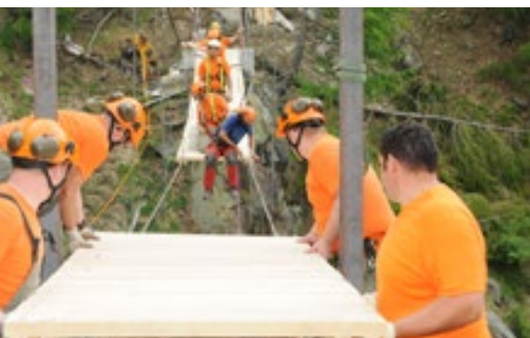
La protection civile établit des ponts.

Pour marquer les cinquante ans de la protection civile suisse, l'Office fédéral de la protection de la population (OFPP) prévoit deux actes symboliques conjointement avec les cantons: planter des arbres et bâtir des ponts.