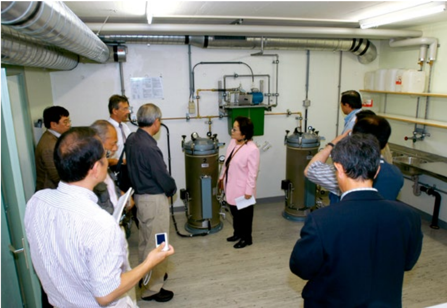
L'intérêt pour l'infrastructure de protection suisse persiste aujourd'hui encore, surtout de la part de régions qui connaissent une situation délicate sur le plan de la sécurité. Ici: une délégation d'Extrême-Orient (2004).

L'aggravation de la guerre froide après l'entrée des troupes soviétiques en Afghanistan à la fin 1979 fait croître l'intérêt pour les ouvrages de protection. L'OFPC répond à près de mille appels concernant des questions d'organisation, et plus spécialement de construction. Dans la plupart des cas, il s'agit de demandes de documents techniques pour la réalisation d'ouvrages de protection. L'OFPC organise aussi des rencontres et conférences internationales qu'il anime conjointement avec l'Union suisse pour la protection civile. La construction d'ouvrages de protection civile devient un secteur important de l'industrie d'exportation.