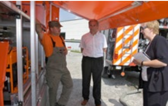
Après la chute du Mur de Berlin, les contacts avec des Etats de l'Europe centrale et orientale ont augmenté. Ici: une délégation tchèque s'intéresse au matériel de la protection civile suisse.