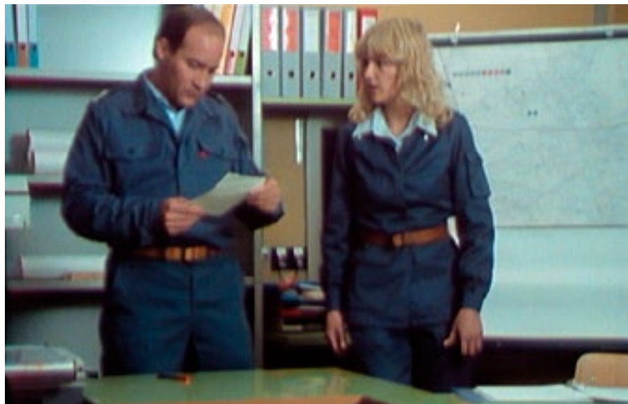
Le chef de l'organisme de protection d'établissement en pleine action.

Chef de la Section Formation à la conduite, OFPP