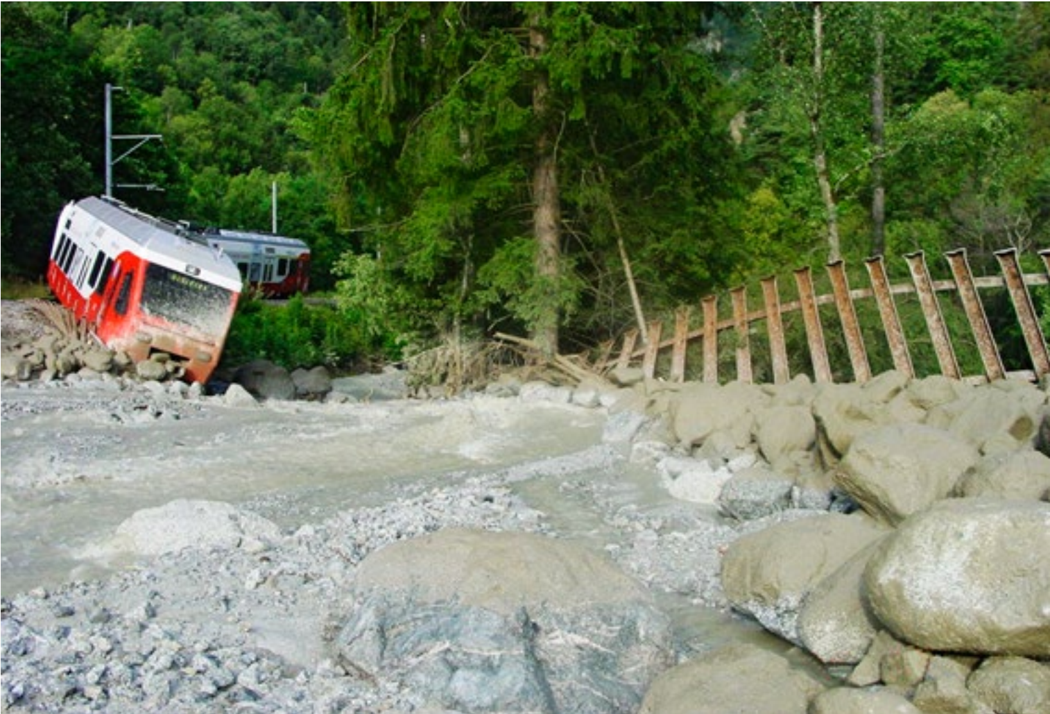
Le train sorti de ses rails, le lendemain matin.

potentiel d'amélioration. Ainsi, le poste de commandement devrait être mieux tenu au courant des décisions prises sur le terrain. Et les personnes touchées par une catastrophe doivent recevoir des informations à intervalles réguliers, même lorsqu'il n'y a rien de nouveau à leur annoncer.