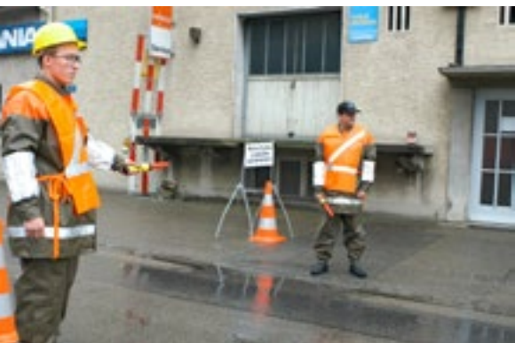
La protection civile soutient la police, par exemple au niveau du barrage de routes.