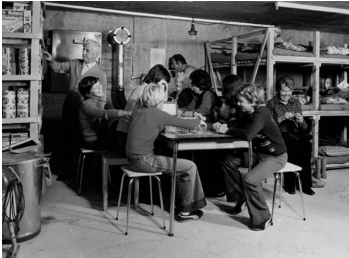
Une scène quelque peu trop idyllique, à l'occasion d'un exercice d'occupation d'un abri effectué dans les années 1970.

En matière d'organisation et d'instruction par contre, des bases appropriées, utilisables dans la pratique, ne voient le jour que vers la fin des années 1970. La formation à la conduite et à l'assistance est donnée – si tant est qu'elle le soit – sous une forme rudimentaire, à l'aide de documents qui changent constamment.