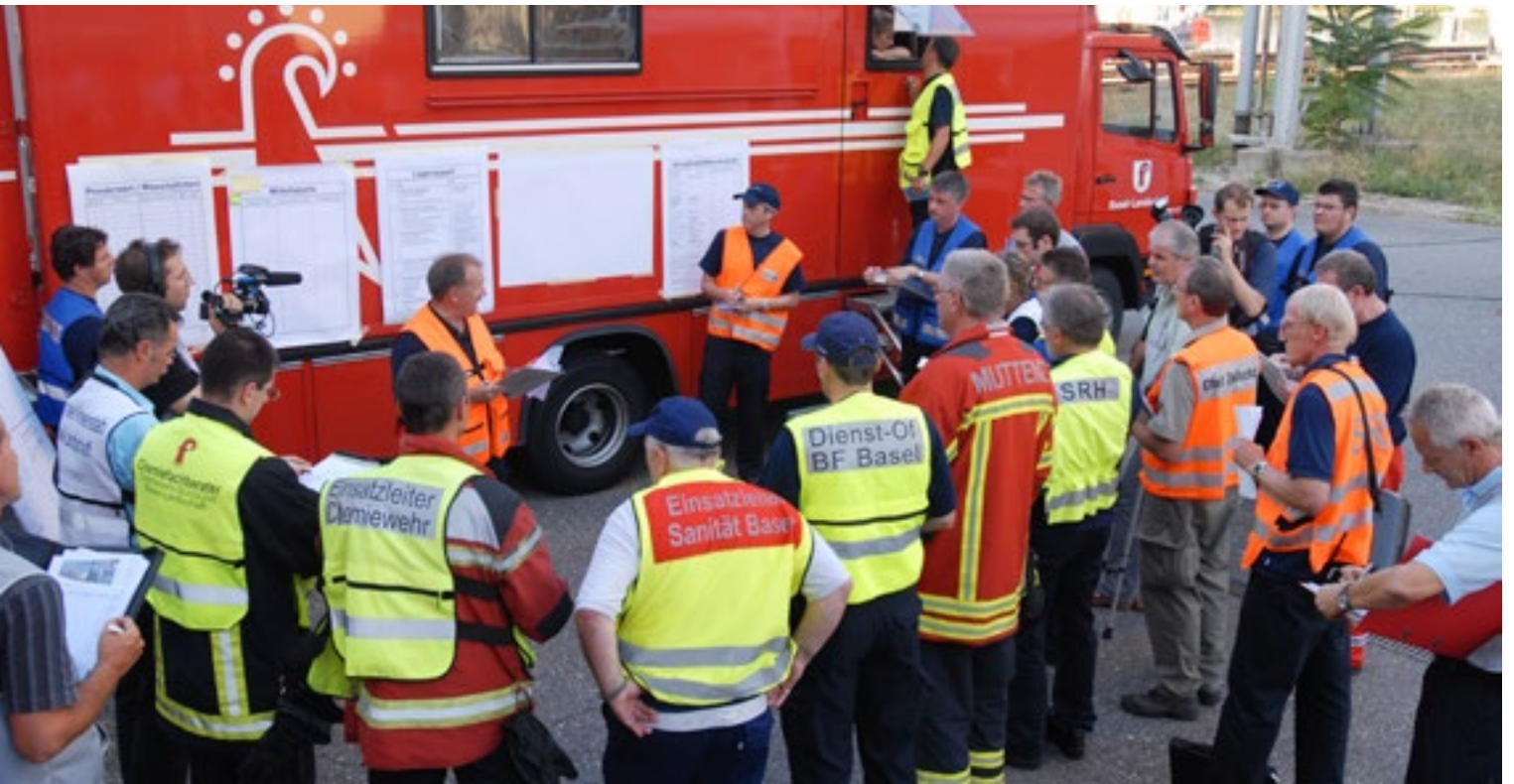
Réunion préparatoire lors d'un exercice général.