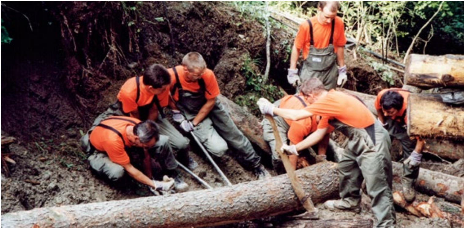
Intervention de la protection civile après des intempéries.