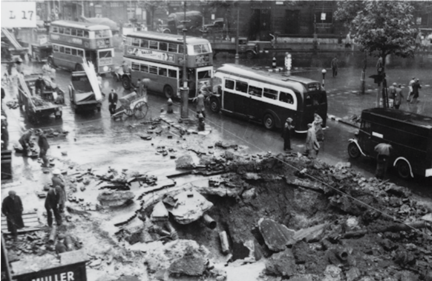
Cratère de bombe à Londres après une attaque aérienne allemande.