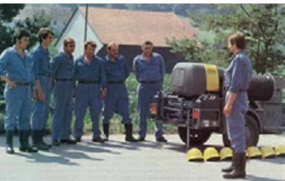
En temps de guerre, l'organisme de protection d'établissement devait aussi lutter contre le feu.

Durant la guerre froide, les grandes entreprises, les administrations, les hôpitaux et les homes ont dû mettre en place des organismes de protection d'établissement. Un instructeur qui faisait ses débuts comme chef de classe en 1983 se souvient de la formation des chefs de ces organismes comme l'un des meilleurs moments de sa carrière.