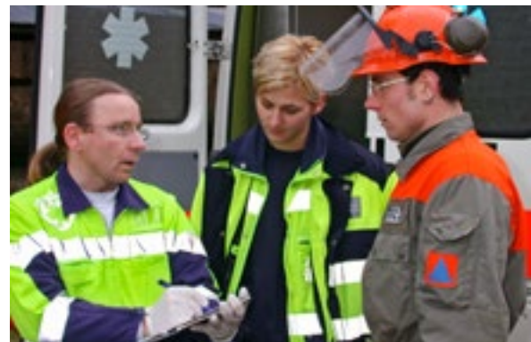
Quelques cantons disposent d'éléments sanitaires de la protection civile en cas de catastrophe.

Il faut spécifiquement mentionner les éléments sanitaires de la protection civile qui, dans quelques rares cantons, n'ont heureusement pas été supprimés lors de la réforme de la protection de la population et qui sont susceptibles d'appuyer la santé publique lors d'événements de longue durée.