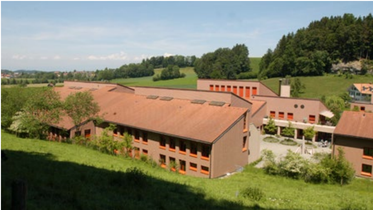
Première étape de construction du Centre fédéral d'instruction de la protection civile de Schwarzenburg.

Schweizerhalle, près de Bâle, le 1 er novembre de la même année, déclenchent des critiques parfois virulentes envers la protection civile – bien que celle-ci n'intervienne aucunement dans le premier événement et seulement de façon marginale dans le second.