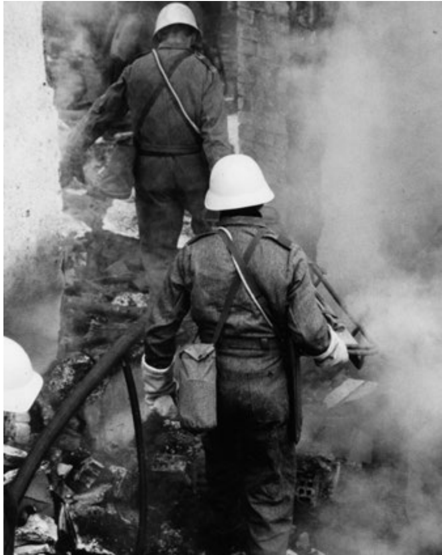
Exercice d'intervention de la protection civile, du temps de la tenue bleue et du casque jaune.

Cependant, pour trouver des solutions réellement nova-