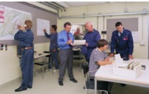
Scène d’un cours d’état-major au Centre fédéral d’instruction de la protection civile de Schwarzenburg.

ment soutenable du tribut à payer à l’organisation fédéraliste de la protection civile, organisation qui tient compte de l’autonomie des communes». Il faut effectivement attendre la fin des années 1980 pour voir se rééquilibrer un tant soit peu le niveau de développement de la protection civile à l’échelle nationale.