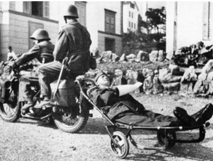
Exercice de sauvetage pendant la Deuxième Guerre mondiale: transport d'un «blessé».

(1928) et Adolf Hitler, après la victoire du parti national-socialiste (NSDAP) aux élections du Reichstag (parlement allemand), est nommé chancelier par le président allemand Paul von Hindenburg (1933). Notre voisin du nord se prépare à la guerre.